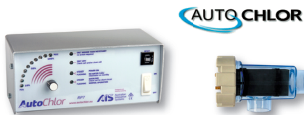
Autochlor Mini RP7

Upozornění: Při použití Systému Autochlor nesmí být v bazénu přítomnost žádné nerezové části (pouze titan), protože při spuštění by mohlo dojít k okamžité korozi.