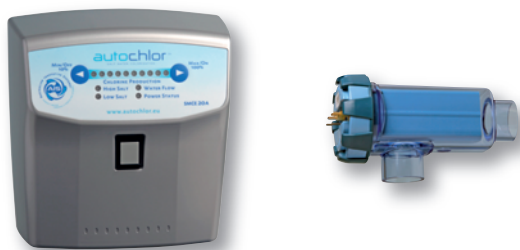
Autochlor AC20SMC, AC30SMC