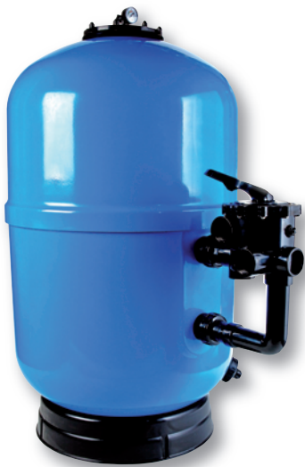
Lisboa 80 Alto

6-ti cestný ventil není zahrnut v ceně 6-way valve is not included in the price